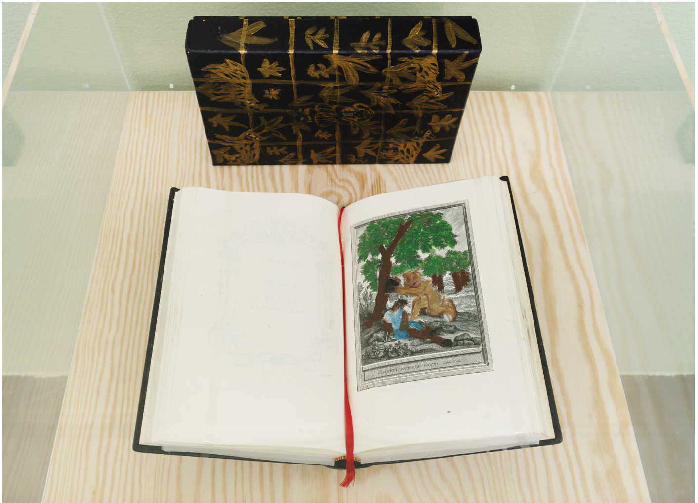
The Fables of Sanbras, 2023.